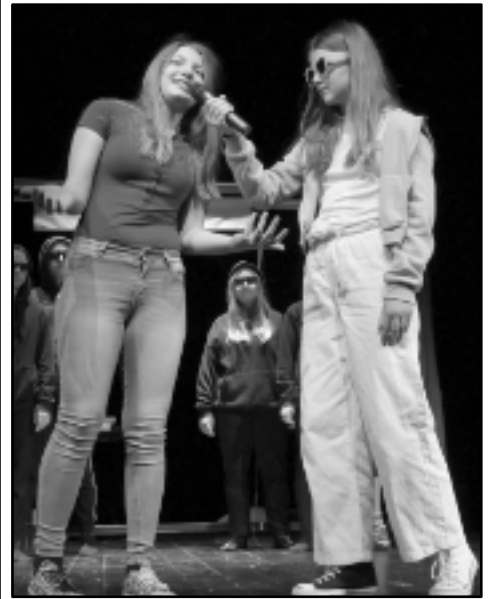
Něco z Koralíny