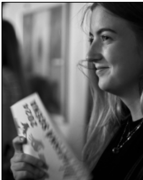
... před představením