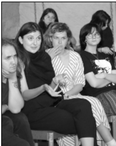
... na veřejné diskusi ve stodole

Zato fotograf Ivo zahlédl všechno a pár střípků vám zprostředkoval skrze fotografie. Kochejte se!