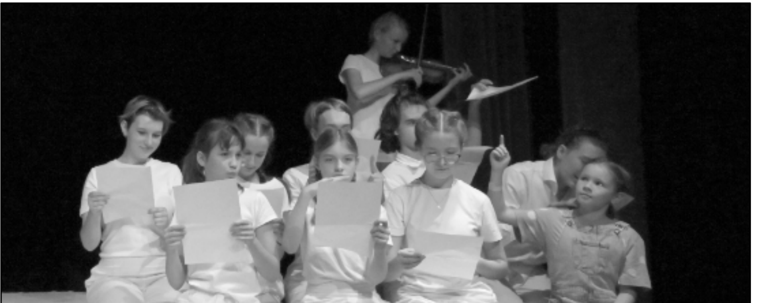
Bublina v bažině