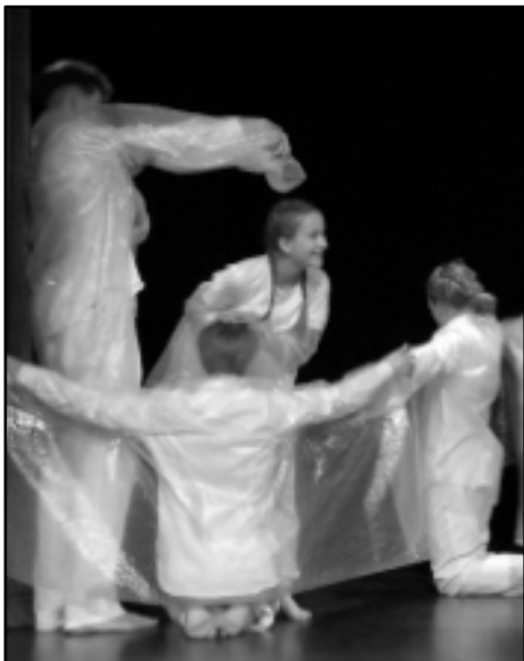
Bublina v bažině