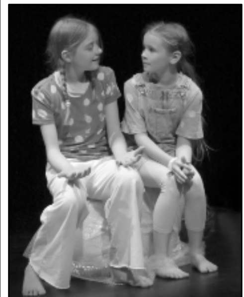
Bublina v bažině