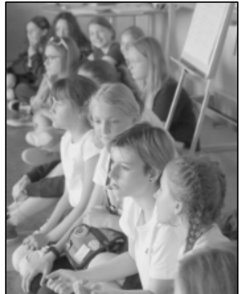
... na dětském diskusním klubu