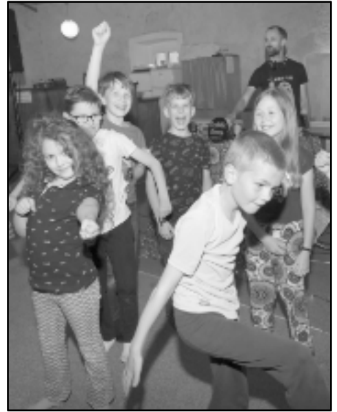
... na hudebním večeru pro soubory