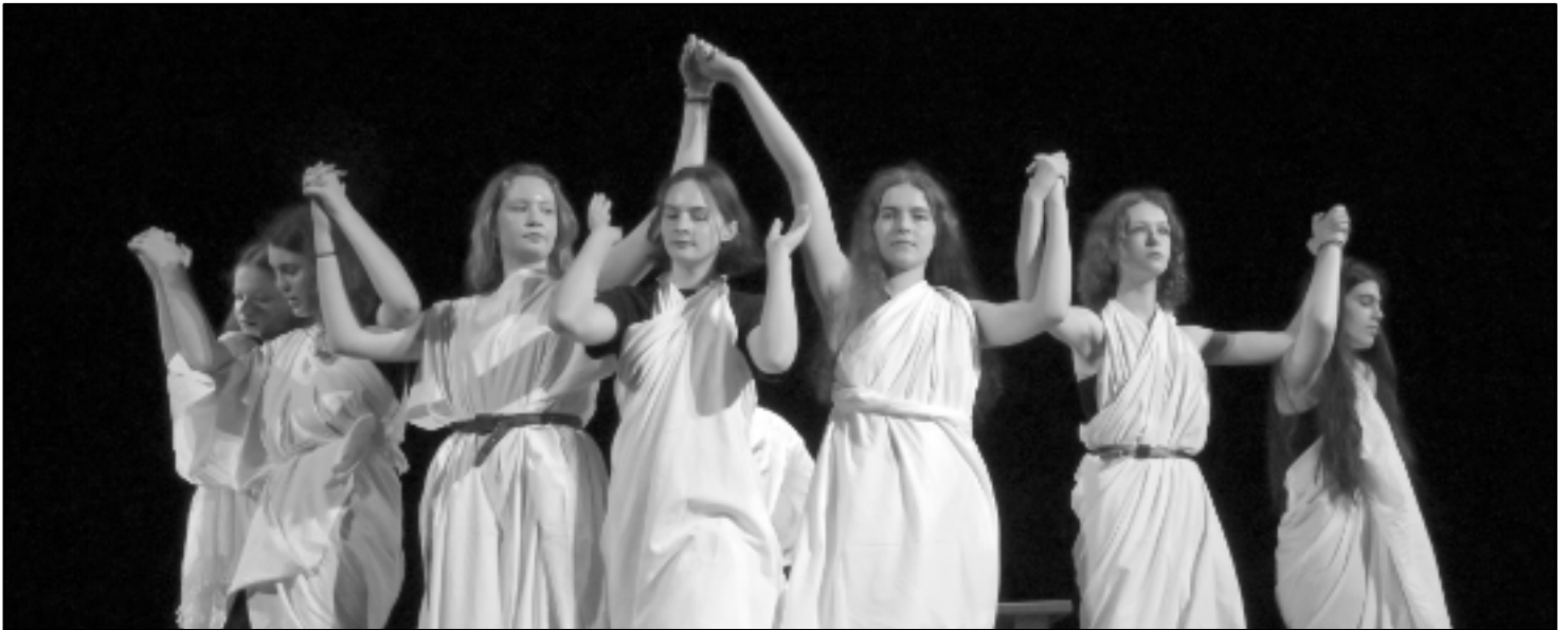
Me too mýtů