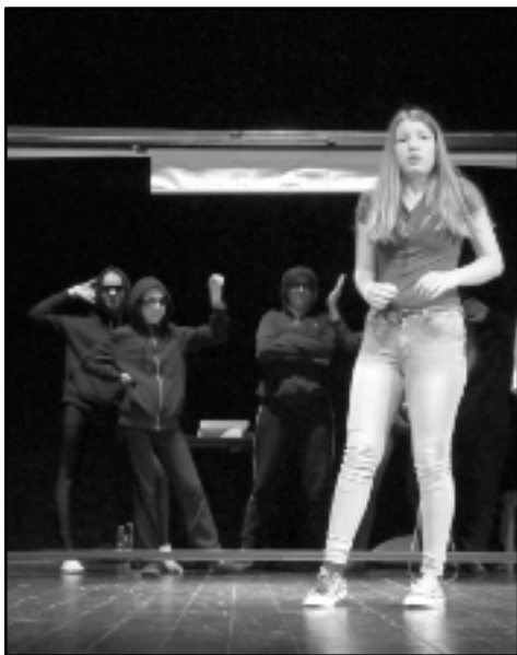
Něco z Koralíny