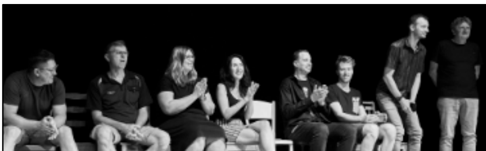
Pracovníci Střediska kulturních služeb Svitavy - díky!