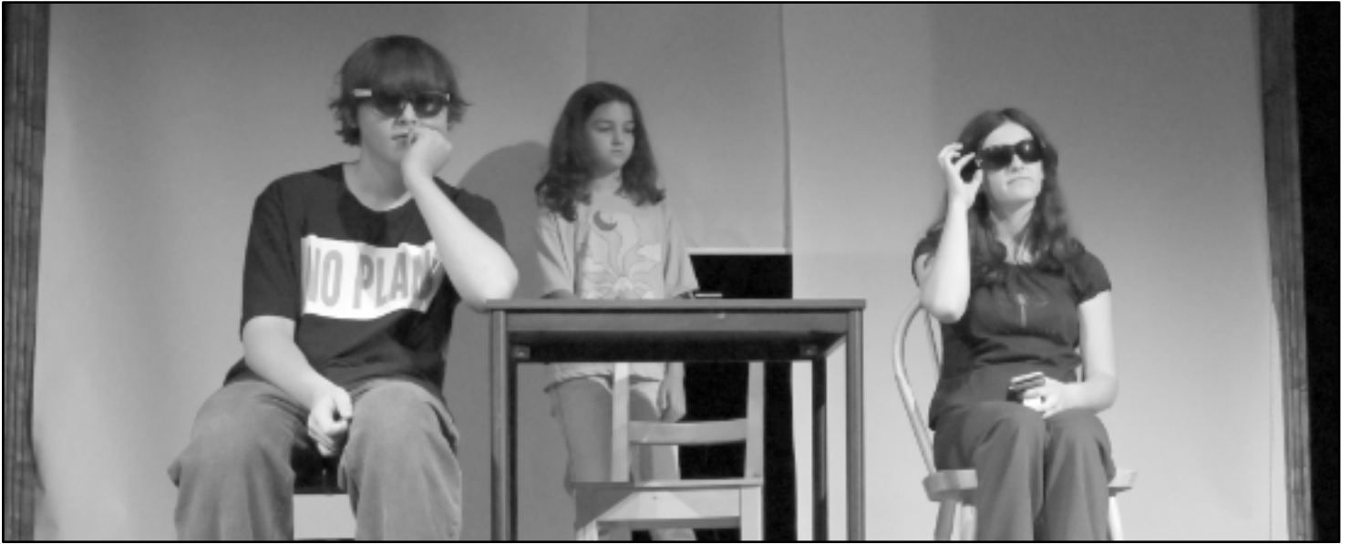
Něco z Koralíny