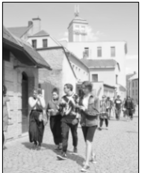
... při přechodu mezi divadly