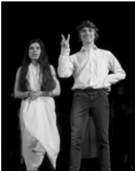
Me too mýtů